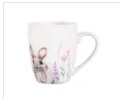
Hello Spring kubek baryłka NBC 300 ml dek. A