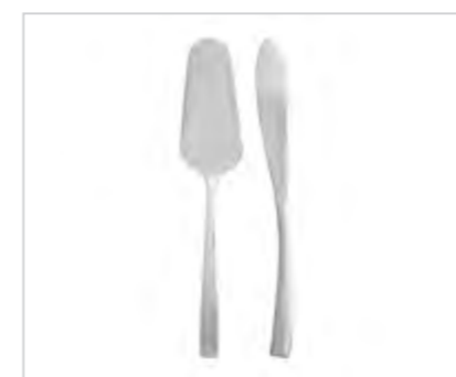
Future nóż i łopatka do ciasta w pudełku flok