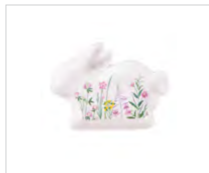
Hello Spring naczynie zając NBC 18x13x2 cm