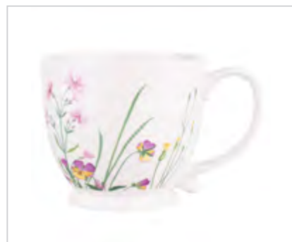
Hello Spring filiżanka jumbo na stopce NBC 400 ml