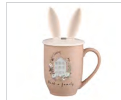
Uszak kubek 350 ml z pokrywką silikonową dek. dom w opasce pvc