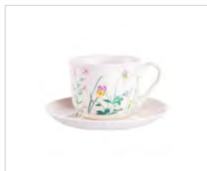
Hello Spring filiżanka jumbo NBC 400 ml ze spodkiem 17 cm w opasce pvc