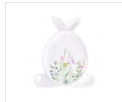
Hello Spring patera zając NBC 26x22x2 cm