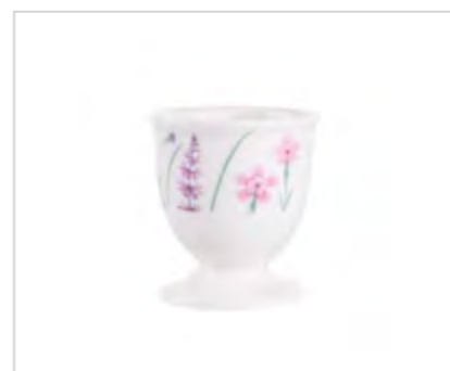
Hello Spring kieliszek do jajka NBC