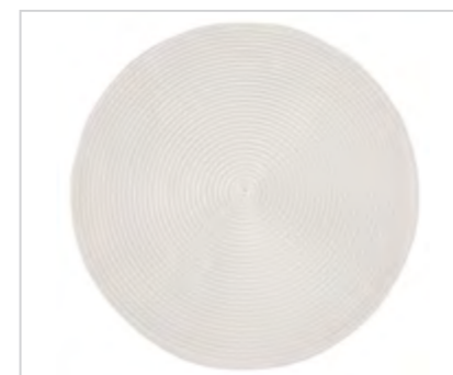
Mata słonkowa 38 cm biała