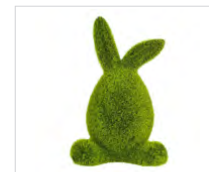
Figurka zając porcelanowa pokryta sztuczną trawą 12x9x18,5 cm