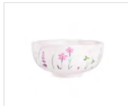
Hello Spring miska NBC 14,5 cm 400 ml