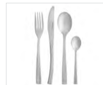
Future sztućce komplet 24 szt. w pudełku flok