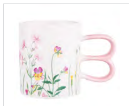
Hello Spring kubek prosty NBC z różowymi uszami zająca 350 ml