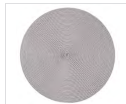
Mata słonkowa 38 cm popiel