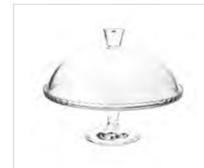
Patera szklana z kloszem 32 cm color box